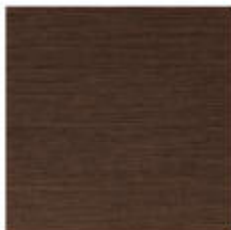
My Ground 45x45 RT_16"x16"