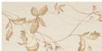
My Light Dec, Shari Color