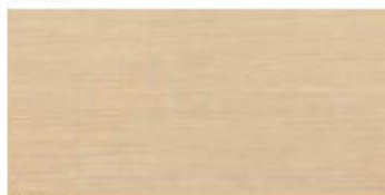
My Sand 30x60 RT_12"x24"