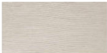
My Storm Dec. Dune Color 30x60 RT_12"x24"