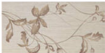
My Storm Dec, Shari Color