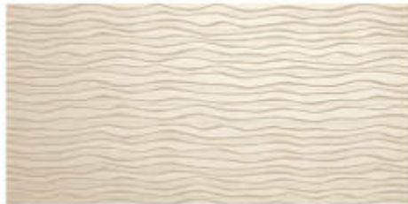
My Light Camp, Lace 45x60 RT_18"x36"