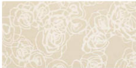
My Light Camp, Chic 45x60 RT_18"x36"