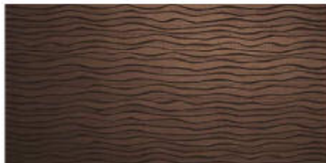
My Ground Camp, Lace 45x60 RT_18"x36"