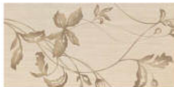
My Skin Dec, Shari Color