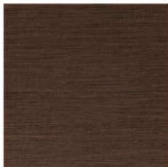
My Ground 60x60 RT_24"x24"