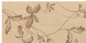
My Sand Dec, Shari Color