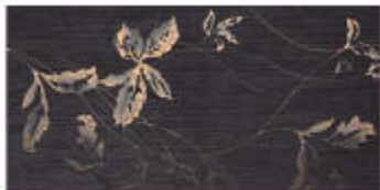
My Dark Dec, Shari Met.