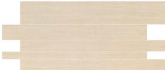
My Skin Doghe* 45x90 RT_16"x36"