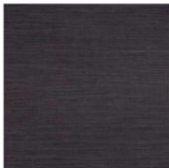
My Dark 66x60 RT_34"x24"