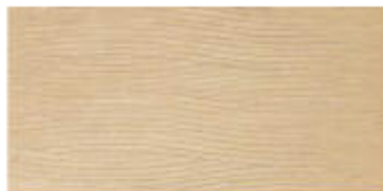
My Sand Dec. Dune Color 30x60 RT_12"x24"