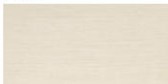
My Light 30x60 RT_12"x24"