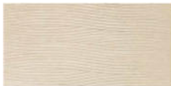
My Skin Dec. Dune Color 30x60 RT_12"x24"

Decore consigliato per l'uso come rivestimento. Décor conseillé pour une utilisation en tant que revêtement. Décor empfohlen für Wandbekleidungen. Decoration suggested for wall covering. Decoración aconsejada para paredes.