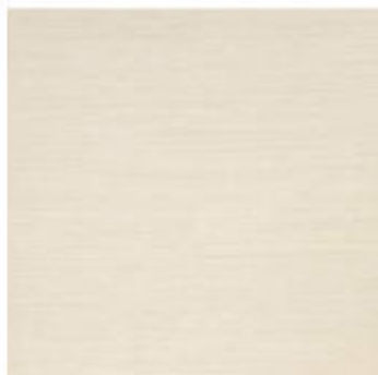
My Light 80x60 RT_34"x24"