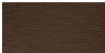
My Ground Dec. Dune Met. 30x60 RT_12"x24"