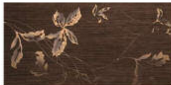
My Ground Dec, Shari Met.