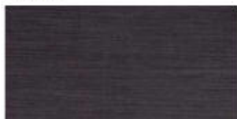
My Dark 30x60 RT_12"x24"