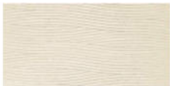
My Light Dec. Dune Color 30x60 RT_12"x24"