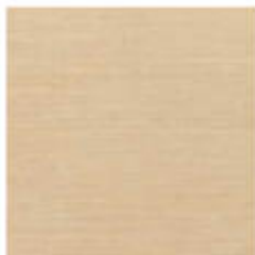
My Sand 45x45 RT_16"x16"