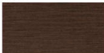
My Ground 30x60 RT_12"x24"