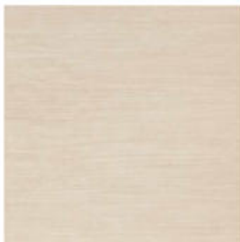
My Skin 60x60 RT_24"x24"