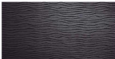
My Dark Camp, Lace 45x60 RT_18"x36"