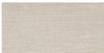
My Storm 30x60 RT_12"x24"