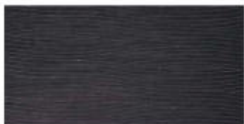
My Dark Dec. Dune Met. 30x60 RT_12"x24"