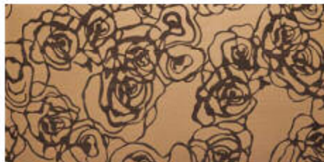
My Ground Camp, Chic 45x60 RT_18"x36"