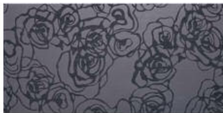
My Dark Camp, Chic 45x60 RT_18"x36"