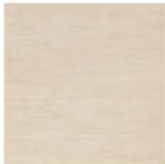
My Skin 45x45 RT_16"x16"