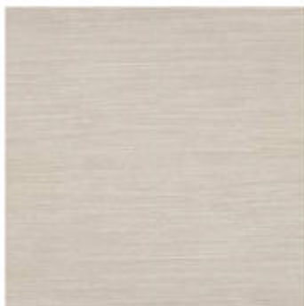
My Storm 80x60 RT_24"x24"