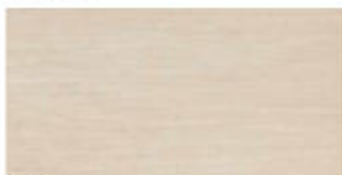
My Skin 30x60 RT_12"x24"