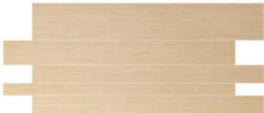
My Sand Doghe* 45x90 RT_16"x36"

* Pesa modulare con fuga di 3 mm. Si consiglia di posare il materiale con pessa sfalciata massima di 1/3. Pose modulaire avec joint de 3 mm. Nous conseillons de poser le matériau avec une pose décalée maximum de 1/3. Modulares Verlegung mit einer Stren Fuge. Es wird empfohlen das Material max. 1/3 versetzt zu verlegen. Modular laying with 3mm joint. It is recommended to lay material with a maximum 1/3 staggered installation pattern. Colocacion modular con juntas de 3 mm. Se aconseja poner el material con una colocación desfasada el máximo de 1/3.