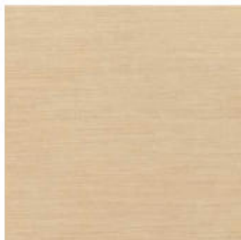
My Sand 60x60 RT_24"x24"